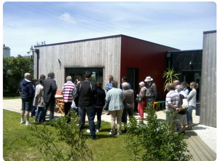
Chantier n°34 : Gîte écoconstruit - Landéda (29)

Une réunion pour faire le bilan de cette 4ème édition sera prochainement programmée. Avis aux intéressé(e)s !