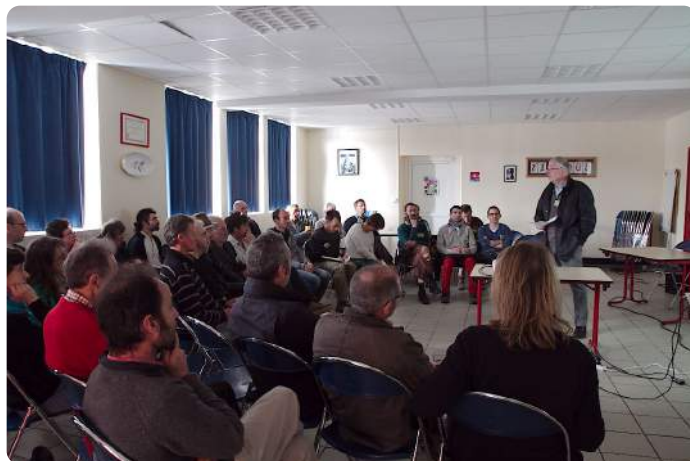
Assemblée Générale 2015