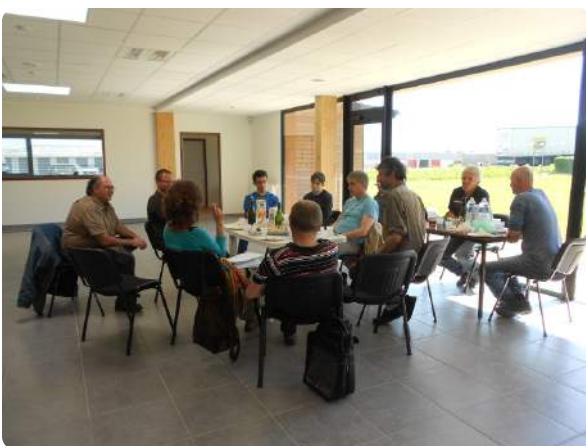
2ème Eco-Lab - Rostrenen - Avril 2015