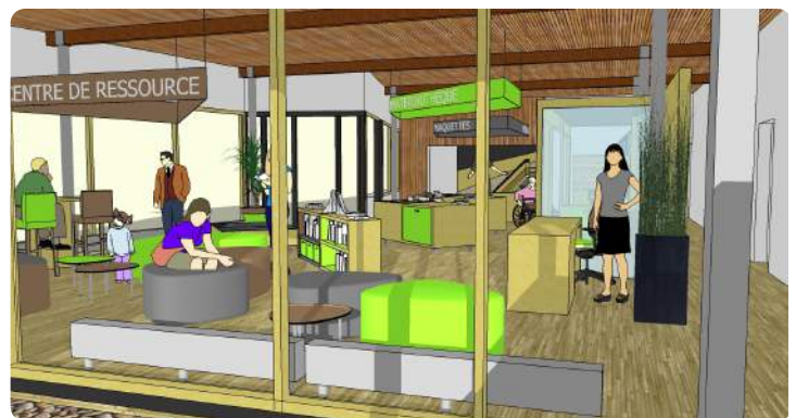
Perspective du hall Conception : Manon Charpentier

Cet espace montrera aux visiteurs les manières d'envisager un jardin écologique, pour poursuivre la réflexion hors de la maison. Conçu comme un outil d'éducation, d'observation et de découverte, il présentera les différents aspects de la diversité biologique, la rotation des cultures et du recyclage matière-énergie.