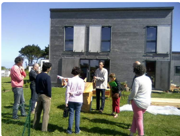
Chantier n°33 : Maison bois bioclimatique - Landéda (29)